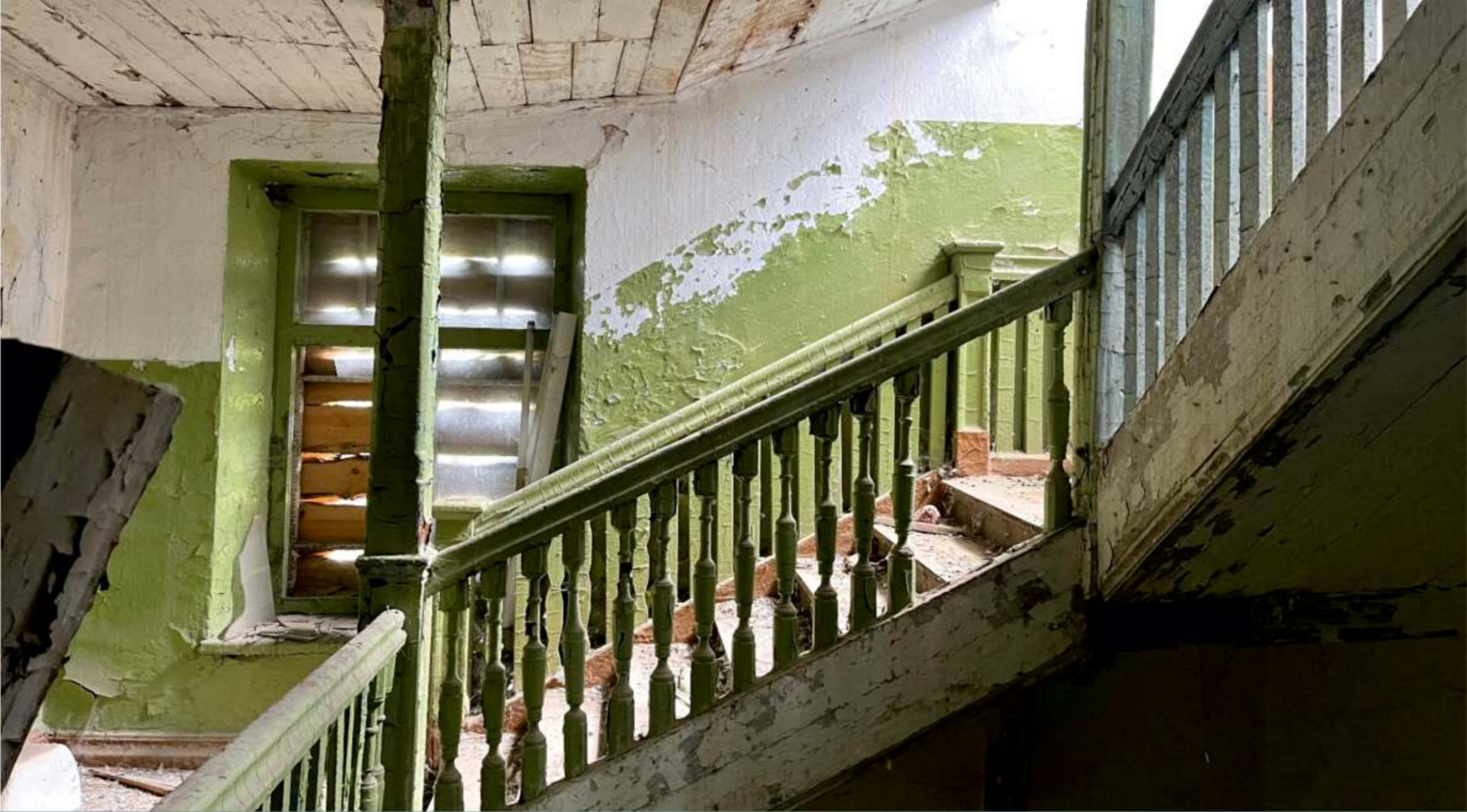
Реставрация исторической деревянной лестницы «Белого дома»