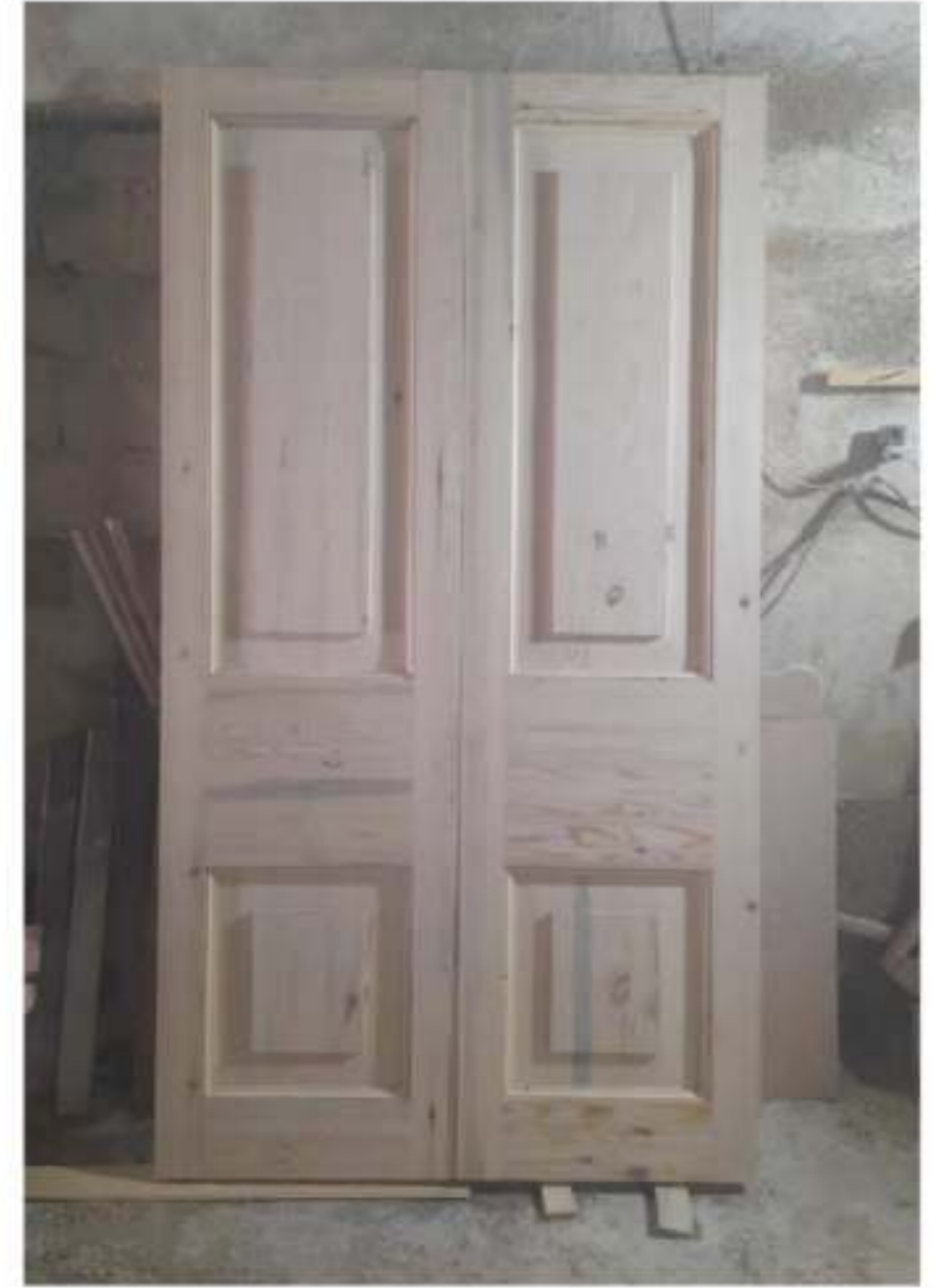
Реставрация исторического деревянного тамбура «Белого дома»