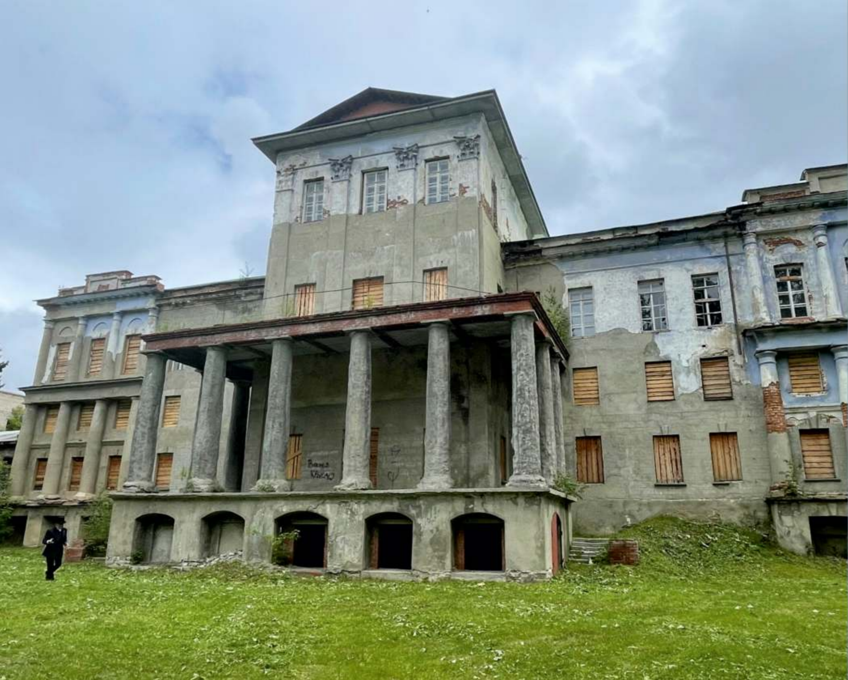
«Белый дом» (август 2022 года)